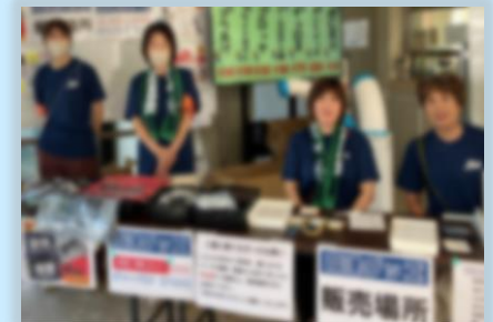
文化祭での高津グッズ販売活動

「無理なく！！」、「ゆるく！！」、「楽しく！！」をモットーに仲間と一緒に、子どもたちの高校生活を支える活動をしています。Make it Kozy！！