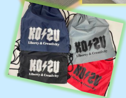
令和6年度の高津グッズ（一部）